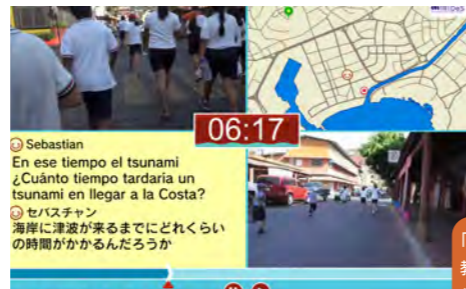
「津波避難カルテ」 教育用アプリ制作 (2016～)