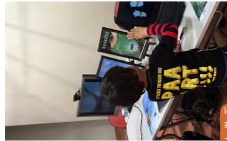
leapmotionを使った 非接触コンテンツ制作 イベント出展 (2018)