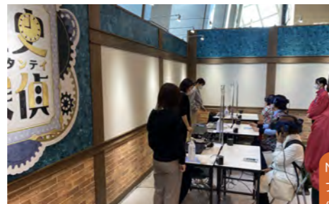
NHK 歴史探偵「VR 大坂城」 ファンイベント VR 出展 (2022)