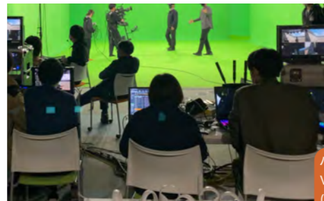
バーチャルプロダクション VR オペレーション風景 (2022)