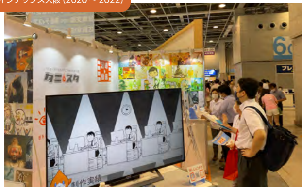
アニメを使った説明動画 出展 インテックス大阪 (2020～2022)

映像制作のステージを自由に拡張することで新しい価値を生み出し、人々の「安心・安全」「知識」「情報の認知と伝達」に貢献する企業としてチャレンジを続けていきます。